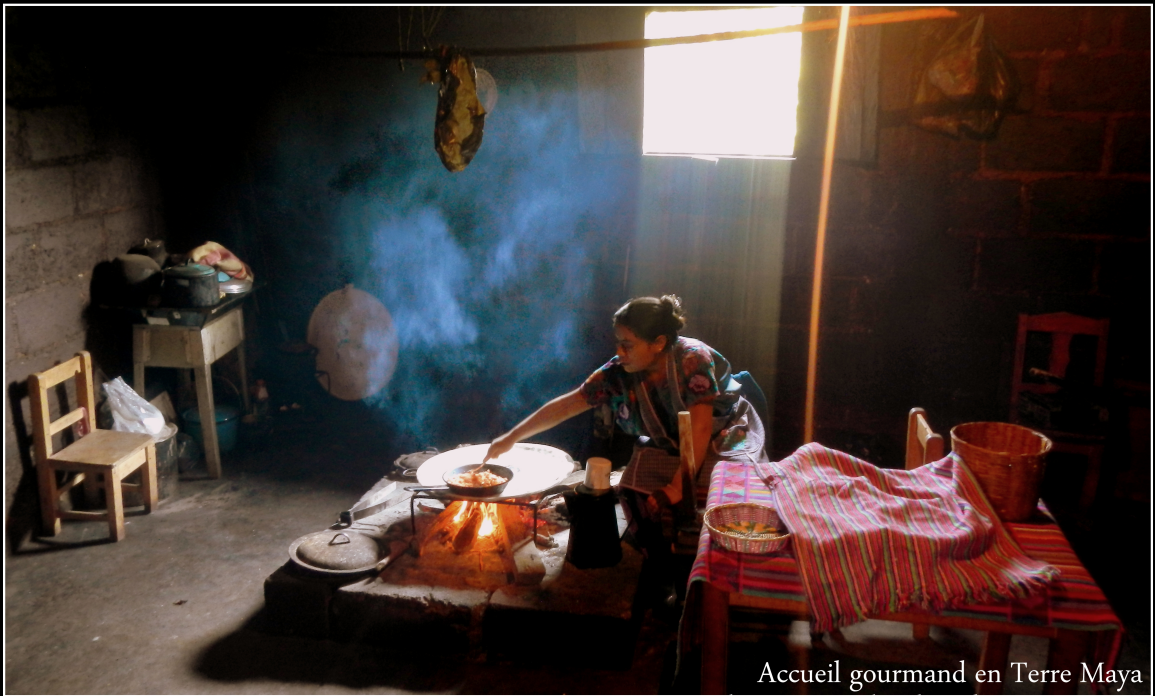
Accueil gourmand en Terre Maya