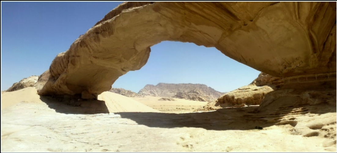
Rêve de sable en Terre jordanienne