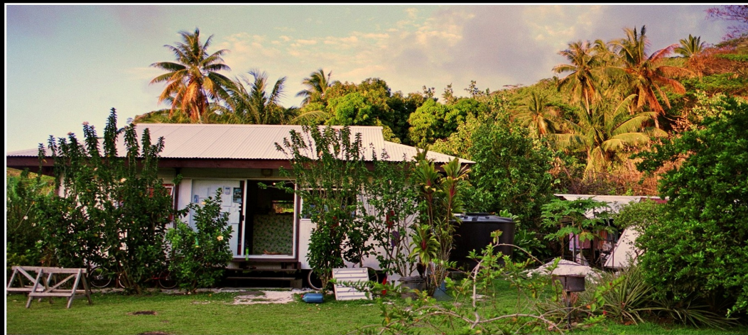
Hospitalité en Terre polynésienne