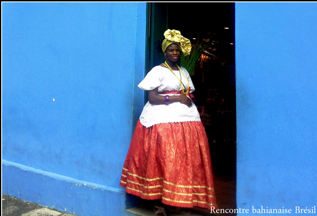
Rencontre bahianaise Brésil