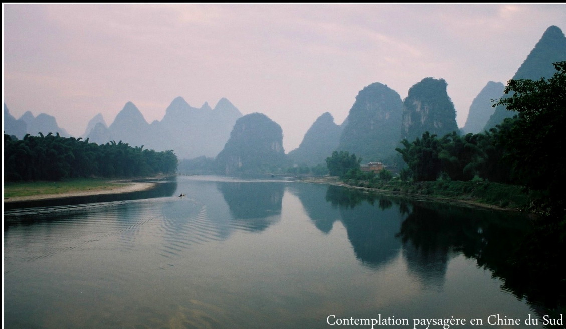
Contemplation paysagère en Chine du Sud

Asie Chine, Laos Vietnam Cambodge, Indonésie, Inde Pacifique Polynésie française Océan Indien Madagascar, Réunion Amérique latine Brésil, Boucle Pérou-Bolivie- Argentine-Chili, Mexique Macaronésie Açores, Madère, Canaries, Cap Vert Out back Australien Kakadu National Park Afrique australe Namibie-Botswana Terres arctiques Islande, Nord Scandinave, Spitzberg