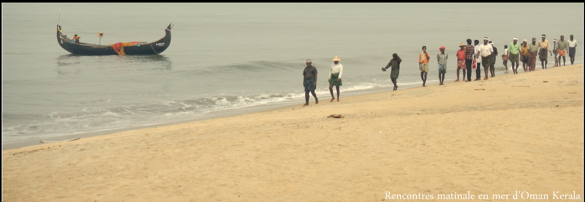
Rencontres matinales en mer d'Oman Kerala