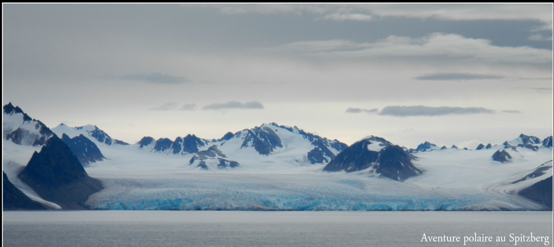
Aventure polaire au Spitzberg