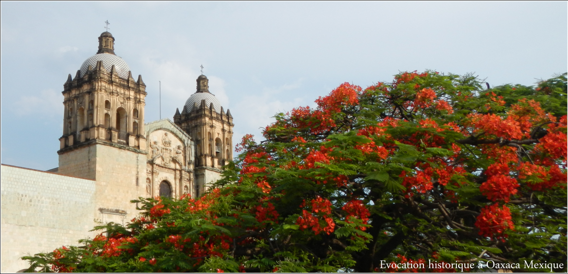
Evocation historique à Oaxaca Mexique