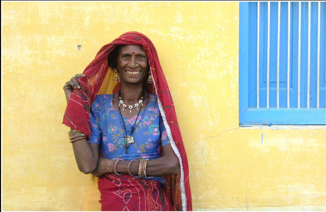
Rencontre Rajasthanie Inde